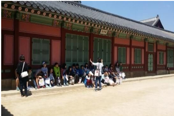
초등학교 현장체험 수업