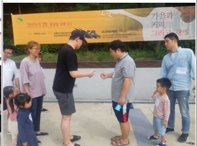
내숲도서관 북스타트 활동 모습