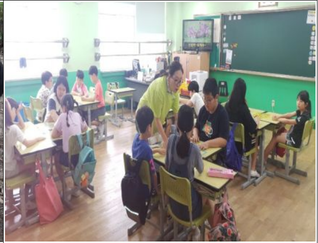
연광초등학교 마을수업 활동 모습