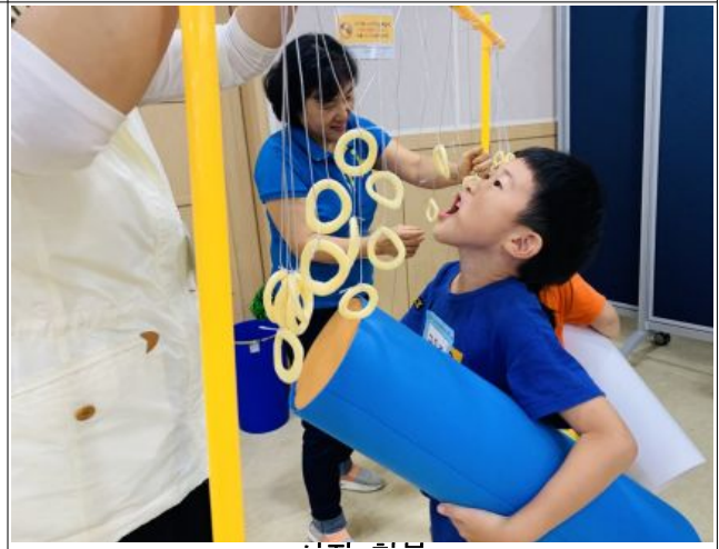
은평뉴타운 도서관 그림책 이야기수업 모습