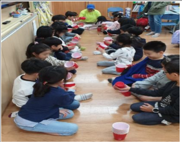
어울초등학교 마을수업 활동