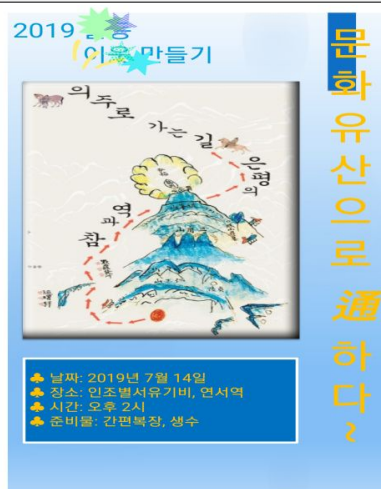
일반인 문화유산 수업 자료