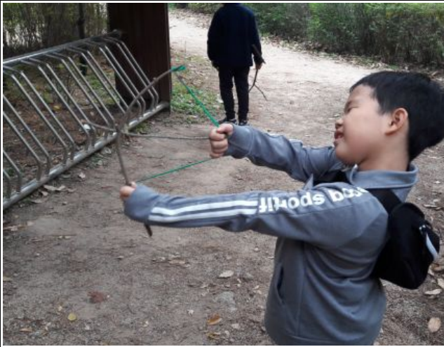
신도초등학교 학생동아리(생태) 수업 활동 모습