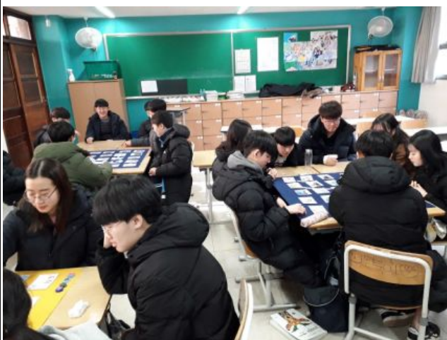
진관중학교 전환기 수업 활동 모습