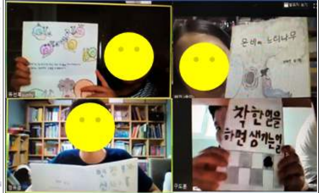
2020 책친구 <나도 그림책 작가> 실시간 온라인 화상수업 장면_작품 설명