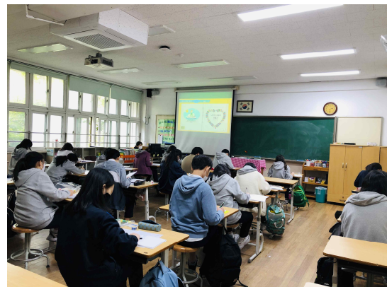
이대부중 <나만의 그림책 만들기> 수업 장면