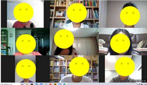
2020 책친구 <나도 그림책 작가> 실시간 온라인 화상수업 장면