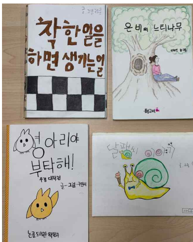
2020 책친구 <나도 그림책 작가> 완성작 중 일부