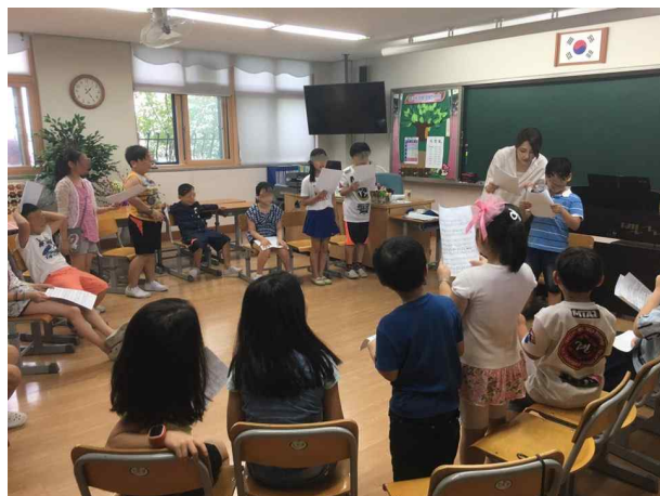
(초등학교) 부분 2부 합창 연습