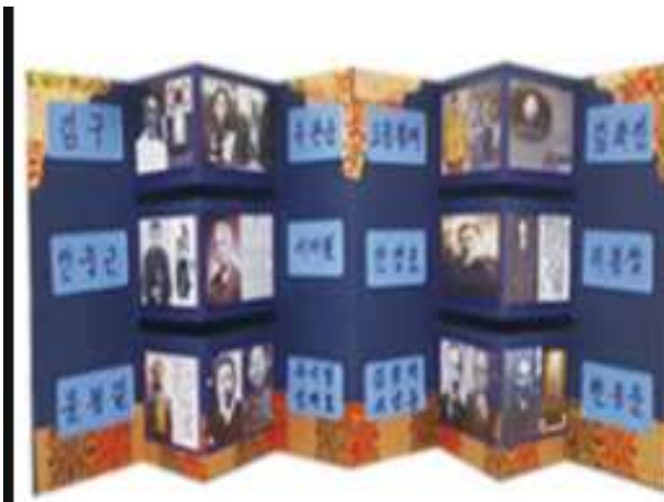
독립운동가 병풍 만들기