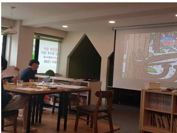
남부교육청 위센터 특별교육수업시 집단심성수련을 위한 그림책 동영상 시연극 대본리딩연습(20')