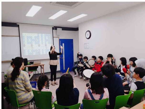
(초등-센터) 합주보에 리듬악기 재창조연주 경험