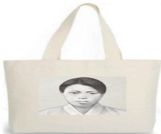
독립운동가 박자혜 에코백