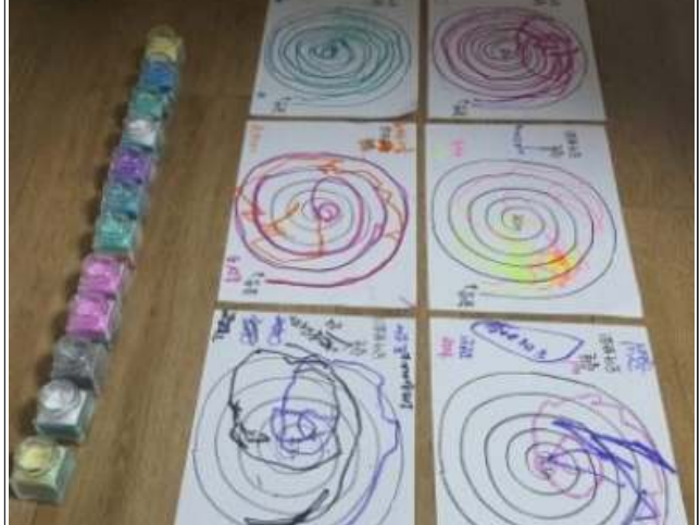
지역아동센터 미술색채야 놀자~