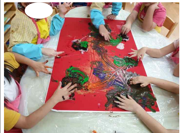
스 스 ㅈ 병설유치원