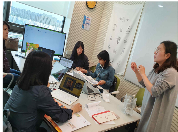
그림책 동영상 제작 컴퓨터 실습 수업 해피어울림협동조합 연구모임