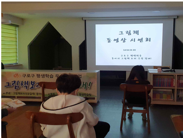
구로구 평생교육지원 그림책보러극장갈래 그림책 동영상 시연회 공연(20')