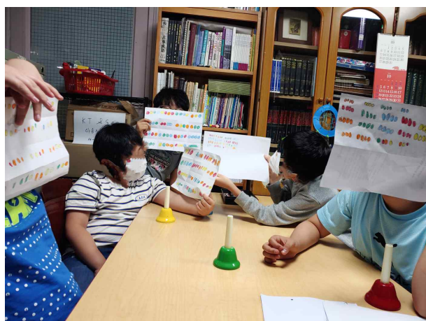
(초등-센터) 핸드벨 색깔로 색칠하여 멜로디 작곡