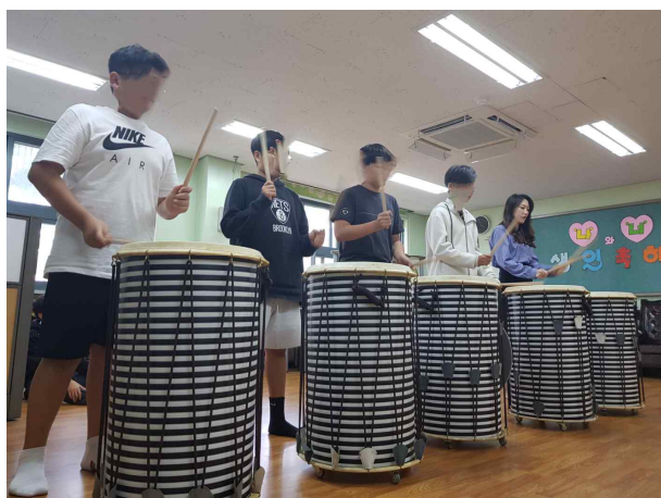
(중학교) 난타 공연 연습