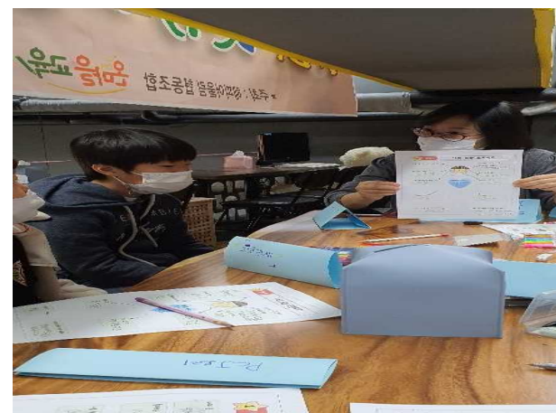
구로구온마을교육 이루어져라 압(20') 집단심성프로그램 자기이해 활동지수업