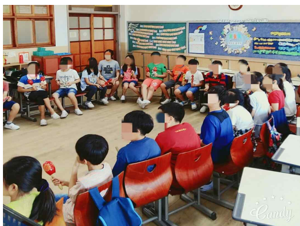
(초등학교) 노래하며 악기연주