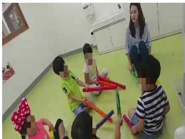
(유치원) 붐웨커를 활용한 즉흥연주