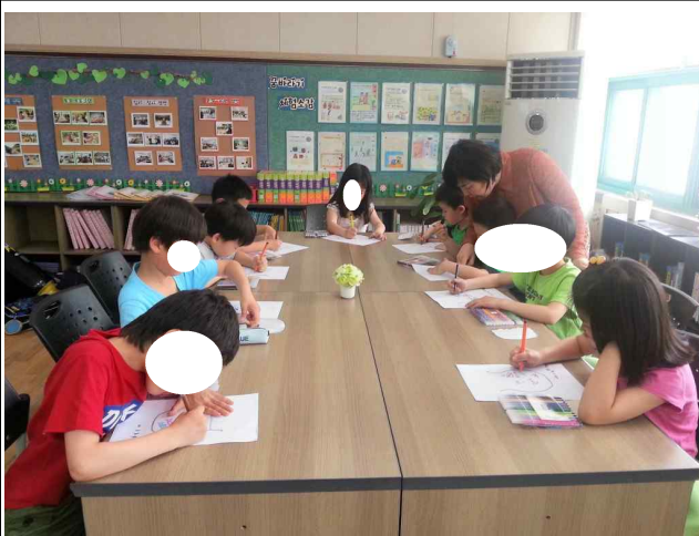
은*초등학교 미술색채야 놀자~