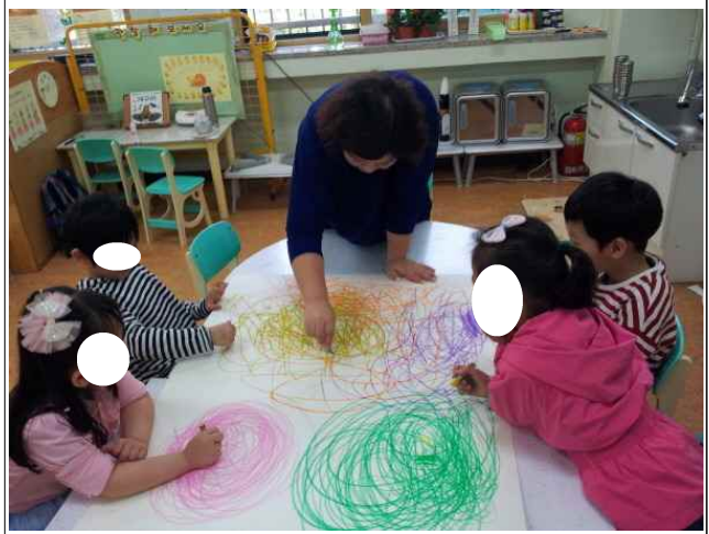
스 ㄱ ㅈ 유치원 색채매체활동